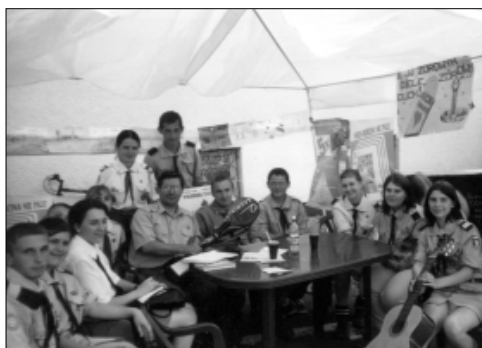
... bezalkoholowe pożegnanie wakacji ...