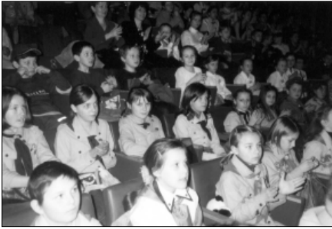
... festiwale i przeglądy ...