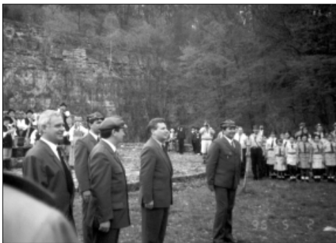
... z prezydentem Aleksandrem Kwaśniewskim...