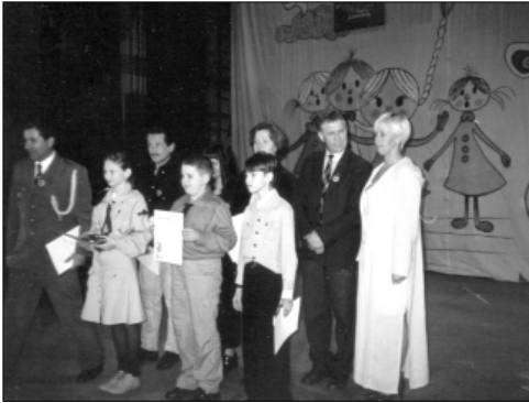
... na festiwalu w Kietrze ...