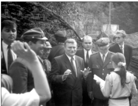
... z prezydentem Lechem Wałęsą ...