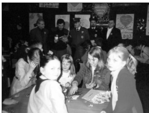
... liczenie pieniędzy dla Wielkiej ...