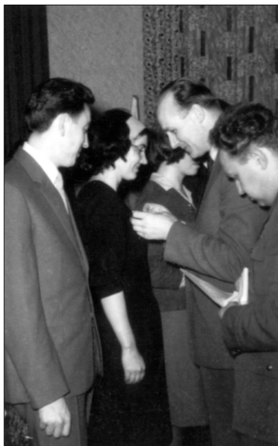
Konferencja Sprawozdawczo - Wyborcza Hufca Głubczyce, 30.01.1965