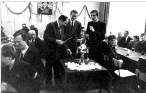
... Świąteczna zbiórka ...

Branice. Skupiała w swoich szeregach 4800 zuchów, harcerzy i instruktorów zorganizowanych w gromady i drużyny harcerskie w szkołach podstawowych, ponadpodstawowych i lokalnym środowisku. W tym okresie Komenda Hufca brała czynny udział w organizacji zimowisk, Harcerskich Akcji Letnich organizowanych dla swoich członków, jak i młodzieży niezrzeszonej. Przeprowadziła także akcje ekologiczną i pomocy społecznej oraz wiele imprez okolicznościowych 76 .