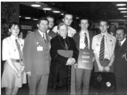
... z ks. prymasem Józefem Glempem ...