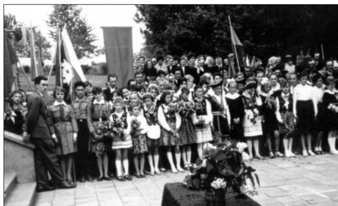
Otwarcie Szkoły Podstawowej w Bogdanowicach - 1962 r

W latach 60 działalność harcerzy nadal była prowadzona z myślą o pogłębianiu wśród młodzieży postaw patriotycznych. Widoczne były silne wpływy wiodącej w kraju partii - PZPR. Pomimo ostrych