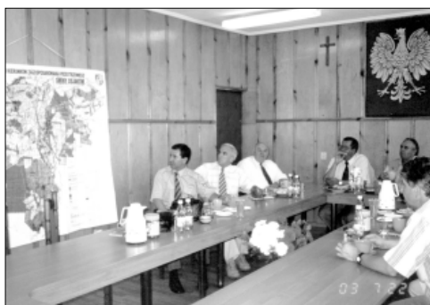
... u przyjaciół w Osjakowie ...