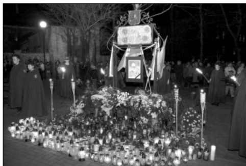
... 2 kwietnia 2005 ...