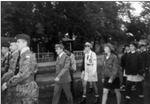
... nie sposób rozpoznać kolejnego udziału harcerzy ...