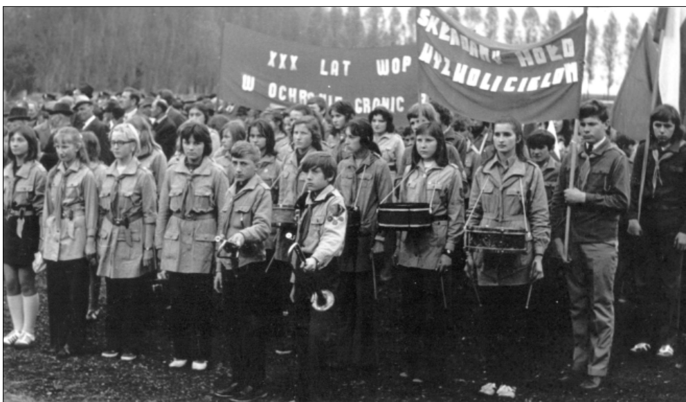
Obchody XXX rocznicy Wojsk Ochrony Pogranicza