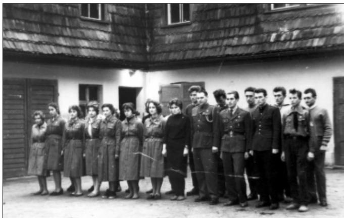
Zimowisko Instruktorów Harcerskich Komendy Chorągwi Opole - Szklarska Poręba 1959/1960

Rozłam harcerskich struktur nie przeszkodził organizacji w przeprowadzeniu wielu imprez, alertów i akcji o charakterze ogólnopolskim. Zorganizowano akcje, które miały na celu odbudowę i zagospodarowanie terenów wyznaczonych przez Związek, m. in.: Jurę Krakowską - Częstochowską, Bieszczady, Sudety, Frombork. W kolejnych latach zostają utworzone wiejskie drużyny harcerskie, powstaje Rada Przyjaciół Harcerstwa, drużyny "Nieprzetartego Szlaku".