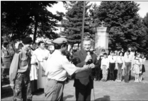
... na majówce w Gołuszowicach ...