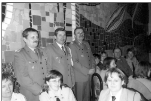
... z dowództwem 10. BLG w Opolu ...