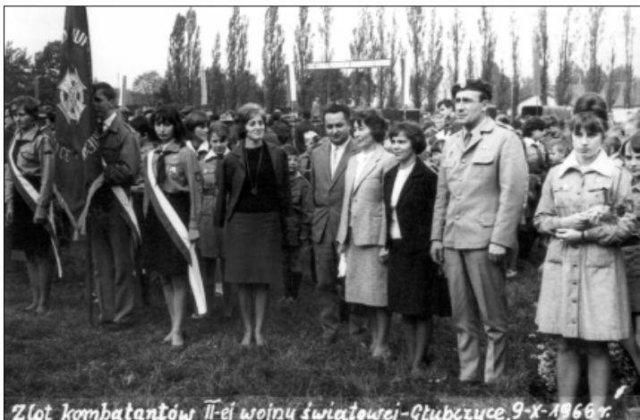
Złot kombatantów II-ej wojny światowej-Głubczyce, 9-X-1966 r.