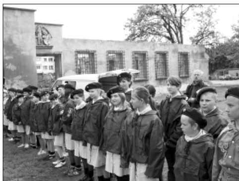
... pod odbudowę ratusza ...