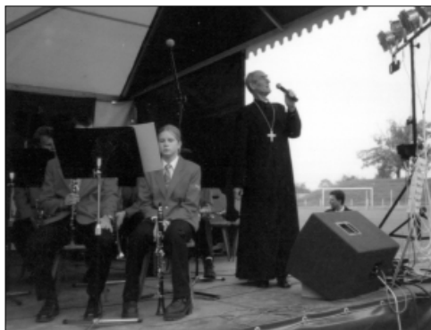
... z arcybiskupem do Unii Europejskiej ...