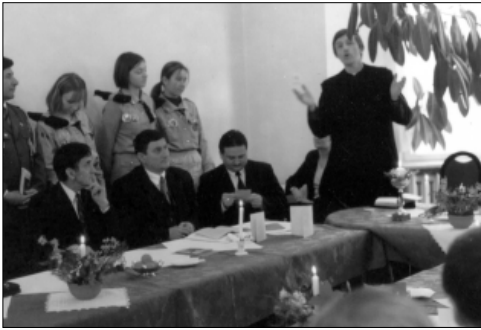
... z Ogniem Betlejemskim na sesji RM ...