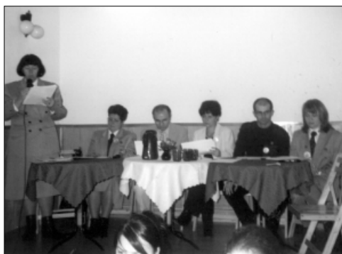
... jury konkursu „Strofy o Ojczyźnie” ...