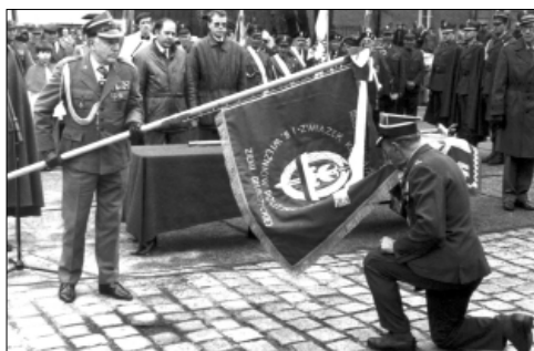
... poświęcenie sztandaru ZKRPiBWP ...