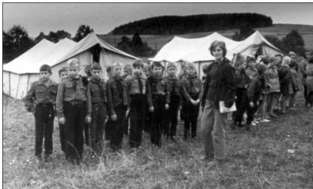
Biwak „Wyprawa Sobieradków”, drużyna Dzielne Zuchy, z dh. T. Idziak, Krasne Pole, wrzesień 1966

W tym samym roku we wszystkich drużynach harcerskich i zuchowych zostały przeprowadzone pogadanki na temat: "Ostrożnie niewypał", "Jezdnia nie dla zabawy", "Ostrożnie z ogniem", "Flaga nad wodą", "Z harcerzem wszystkim jest dobrze" 44 oraz przeprowadzono akcję mającą na celu przegląd mundurów harcerskich i zuchowych 45 .