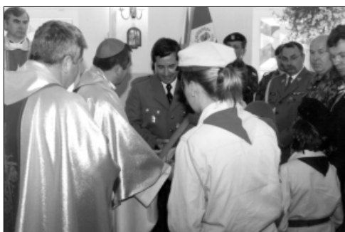
... z naczelnym kapłanem WP ...