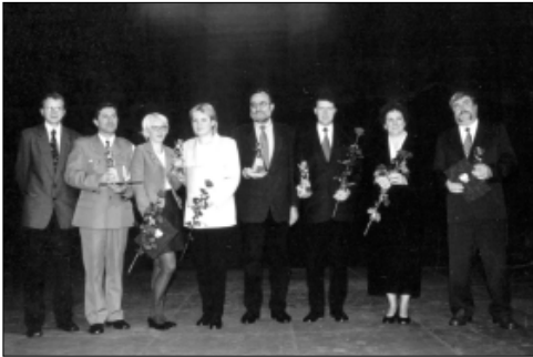
... z „Głubczyckim Lwem” ...