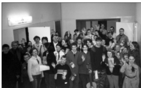
... Orkiestry Świątecznej Pomocy ...