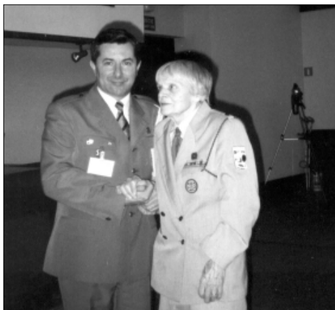
... z najstarszą harcerką ...

W 1993 r. Komenda Hufca ZHP w Głubczycach funkcjonowała na terenie 5 gmin: Głubczyce, Kietrz, Baborów, Głogówek i