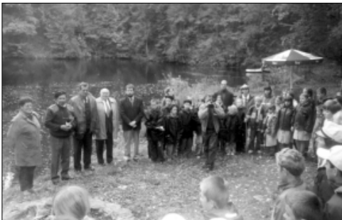
... władze wysoko oceniły ...

niu Wakacji, wystawie poświęconej historii wsi Włodzienin, w XVIII Rajdzie Jesiennym oraz w cyklicznej "Akcji Znicz" 86 .