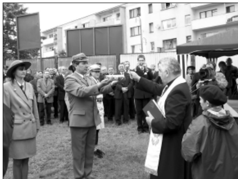
... w poświęceniu Aktu Erekcyjnego ...