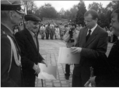
... przy Pomniku Żołnierza Polskiego ...