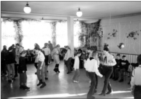
... HAZ - SP nr 1 ...