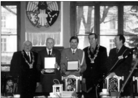
... ze Srebrnym Herbem Głubczyc ...