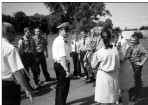
... o bezpieczeństwie i sprawności ...