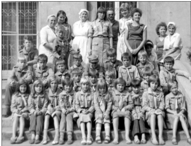
Kolonie letnie, Łódź - 1984