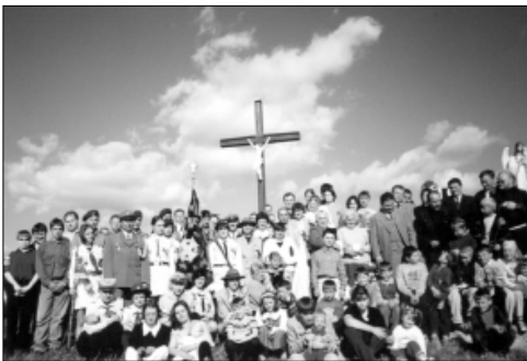
... na otwarciu parku w Braciszowie ...

brali udział w III Przeglądzie Opolskiej Piosenki Harcerskiej, z którego przywieźli wiele nagród i wyróżnień 80 .