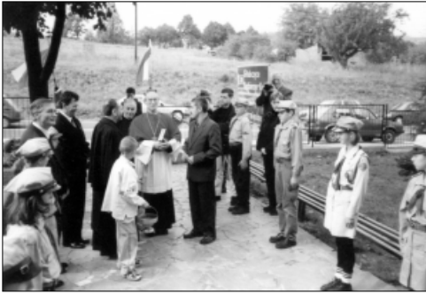
... imienia JP II szkole w Pietrowicach ...