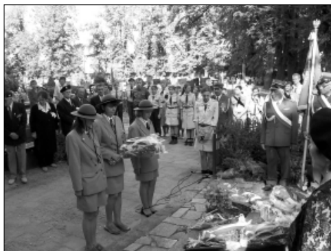
... w Dniu Sybiraka ...