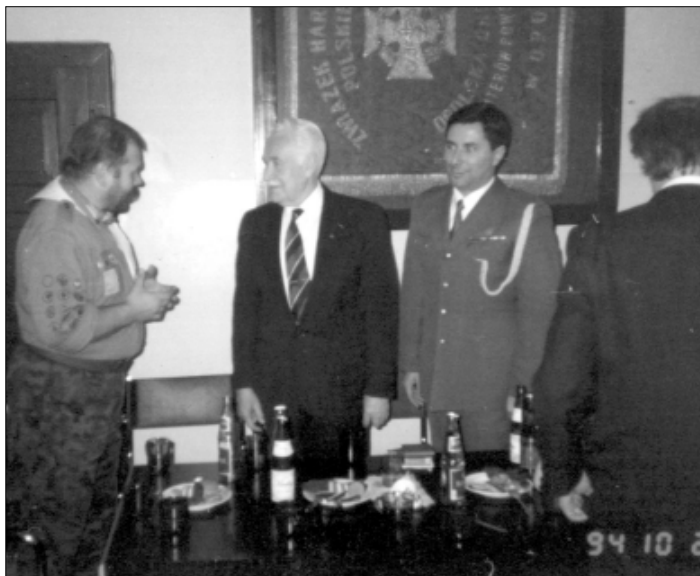
... z prezydentem Ryszardem Kaczorowskim ...

W 1956 r. na Walnym Zjeździe ZHP w Łodzi powzięto uchwałę określającą harcerstwo jako "organizację polityczną, świecką i koedukacyjną" 28 . W ten sposób zła-