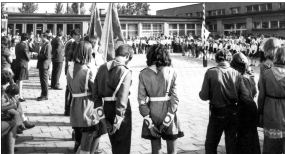
Inauguracja roku szkolnego W poczcie sztandarowym harcerze drużyny Młodzieżowej Służby Ruchu