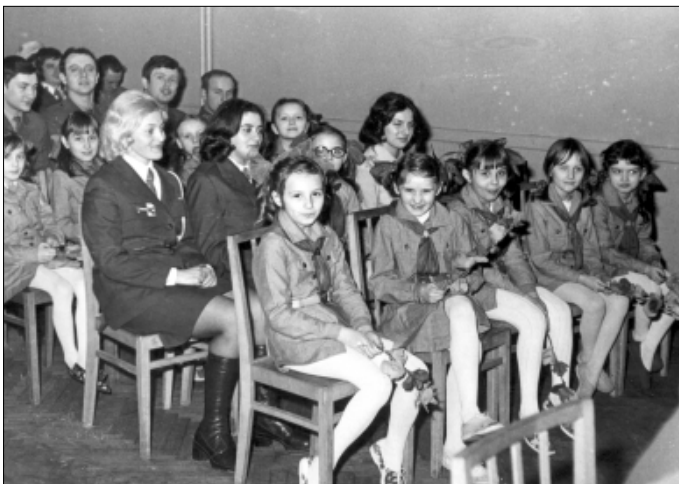
Festiwal Piosenki Harcerskiej i Zuchowej,

W latach 70 dużą aktywnością społeczną wykazywały się szczepty zuchowe oraz harcerskie. I tak m. in. 89 drużyna zuchowa "Niezapominajek" przy Szkole Podstawowej nr 1 w Kietrze przeprowadziła akcję zalesiania terenu (1971) 53 , 81 drużyna "Nad-