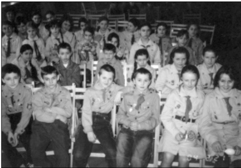
... nasza przyszłość ...